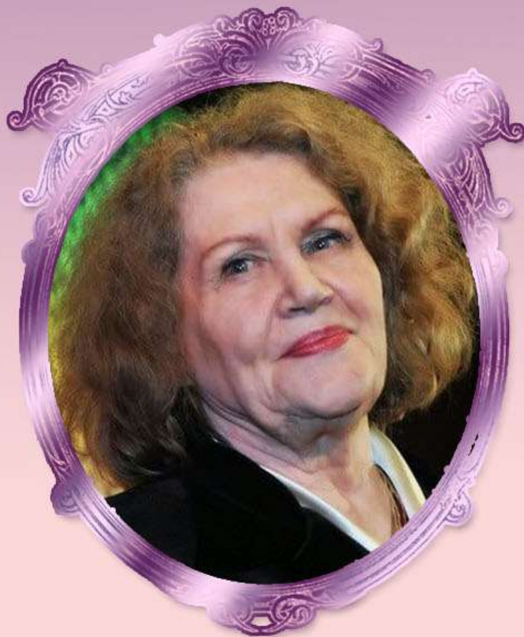
Ліна Костенко Видатна поетеса сучасності